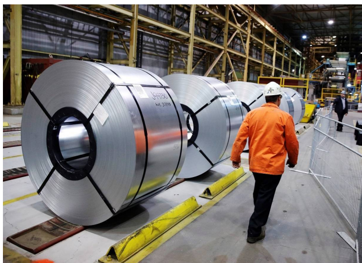
Sobretaxa do aço nos EUA tem sido alvo de críticas Foto: Reuters

(Por Philip Blenkinsop) FONTE: www.dci.com.br